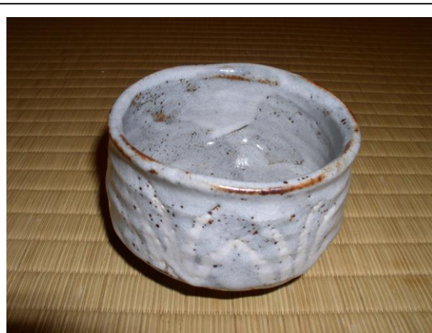
No.100 茶碗 (織部)