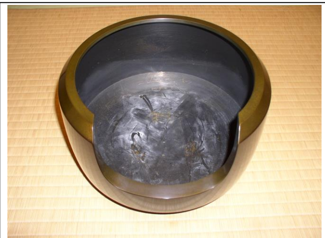
No.15 風炉釜 (阿弥陀堂)