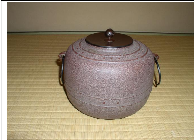
No.7 釜 (万代屋 (高橋敬典) )