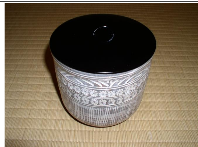
No.62 水差 (弥七田織部)