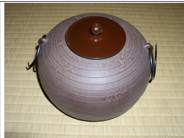
No.12 鬼面風炉(唐銅鬼面風炉 平丸釜添)