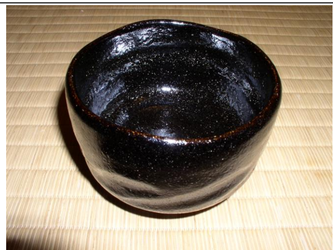
No.98 茶碗 (萩 枝垂れ桜)