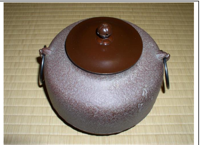
No.9 釜 (真形浜松地紋 (高橋敬典) )