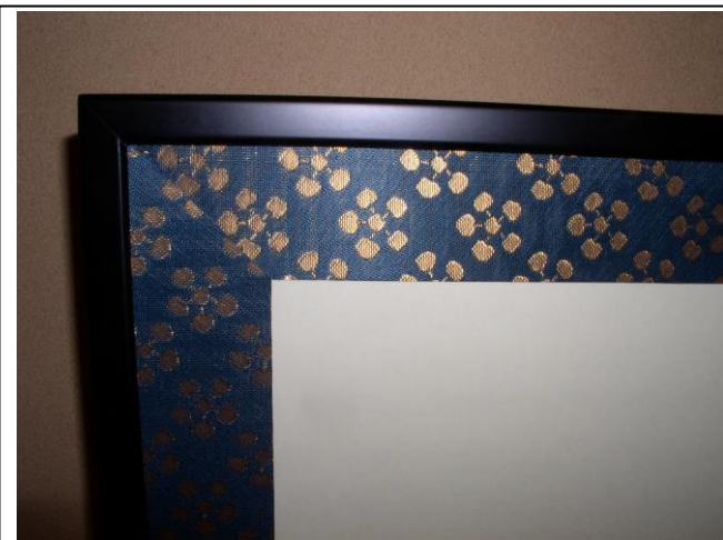
No.29 風炉先屏風 (桑縁、捻梅) 2 尺 4 寸