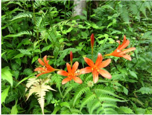
キツネノカミソリ